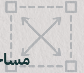
مساحات مدروسة Thoughtful spaces