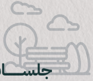
جلسات خارجية Outdoor sessions