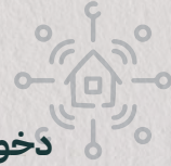
دخول ذكي Smart Entry