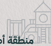
منطقة أطفال Children's area