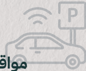
مواقف خاصة Private parking