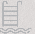
مسابح خاصة private pools