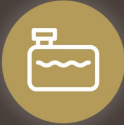
خزان مياة مستقل