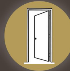
ابواب داخلية WPC