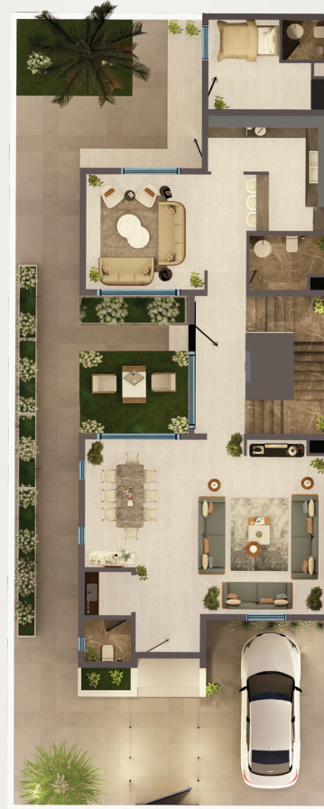
مسطح البناء الدور الأرضي