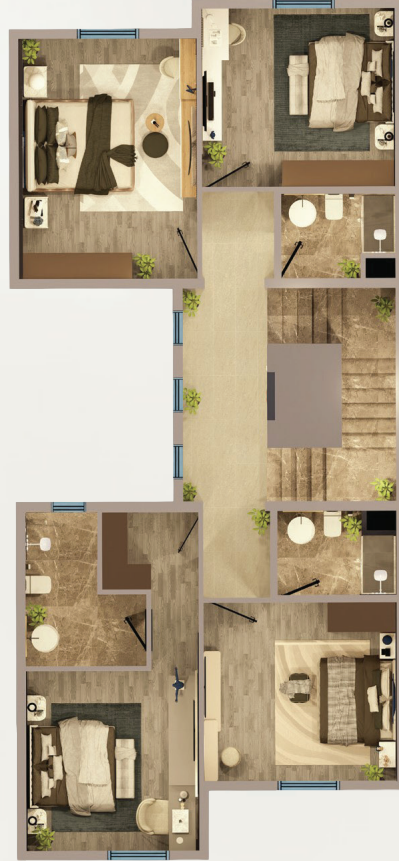
مسطح البناء الدور الأول