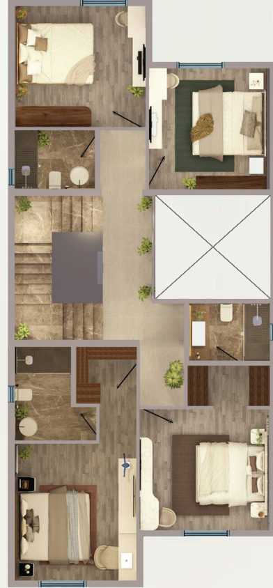
مسطح البناء الدور الأول