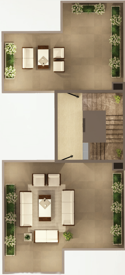
مسطح البناء الدور الثاني