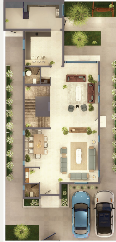
مسطح البناء الدور الأرضي