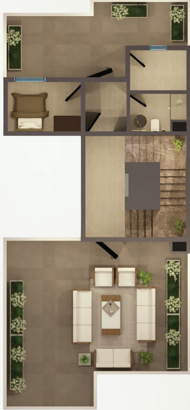
مسطح البناء الدور الثاني