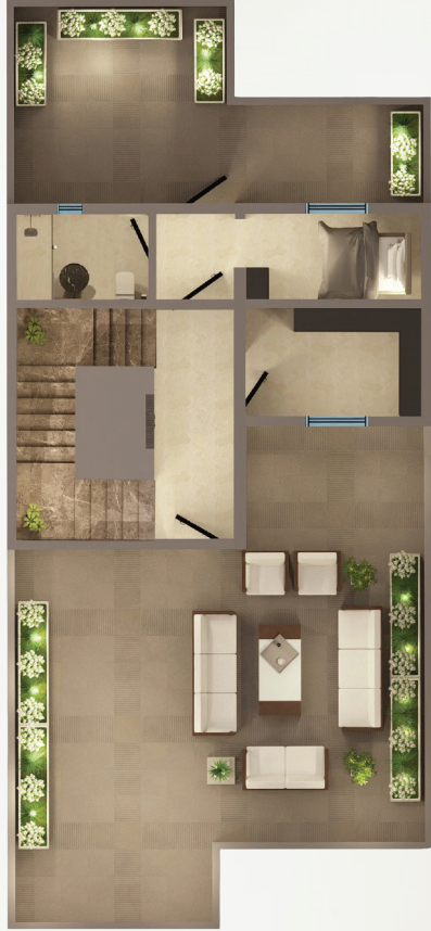
مسطح البناء الدور الثاني