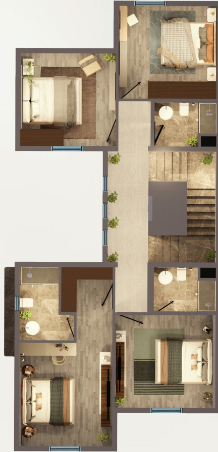
مسطح البناء الدور الأول