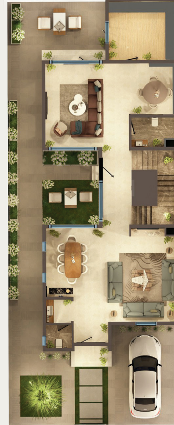
مسطح البناء الدور الأرضي