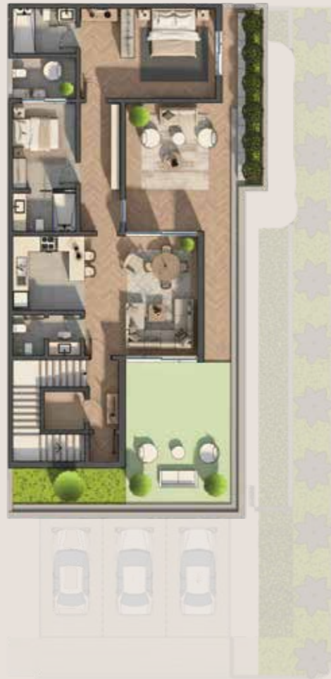
المساحة 123 م 2