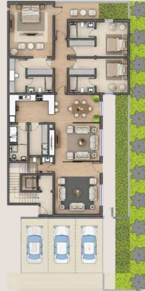
المساحة 239 م 2