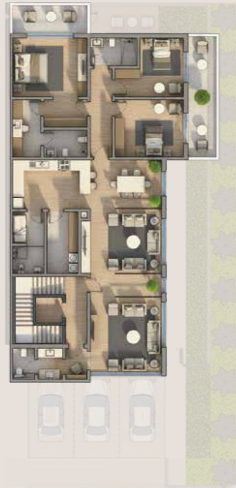
المساحة 219 م 2